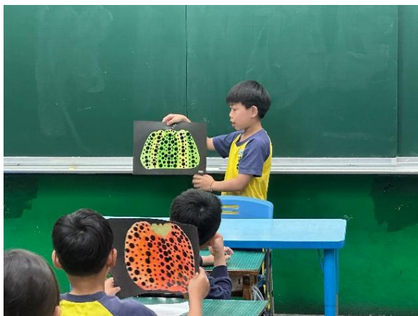
說明：學生發表自己的創作想法