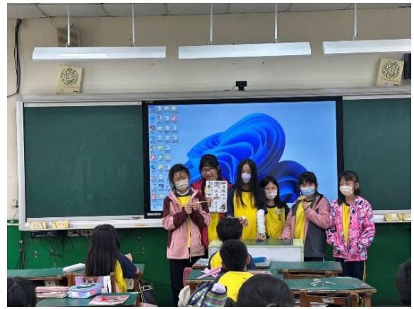
說明：分享自製玩具