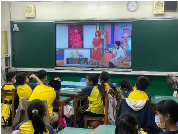
說明：點點南瓜—認識草間彌生