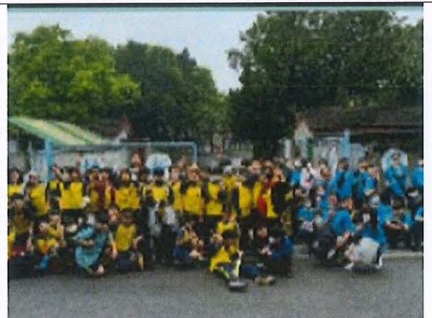
說明：六年級走讀馬祖新村