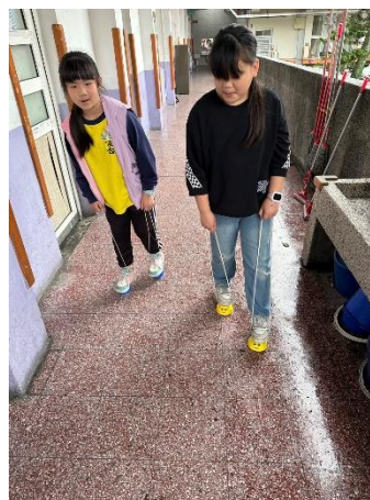
說明：童玩體驗—踩高蹺