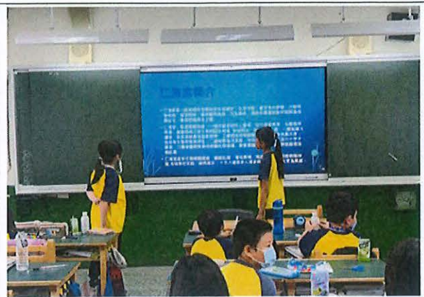
說明：五年級認識仁海宮