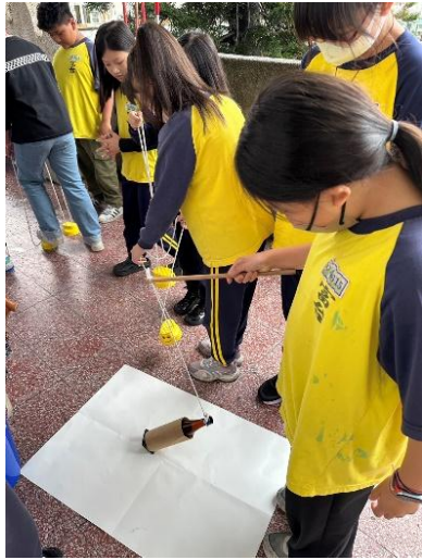
說明：童玩體驗—吊瓶子