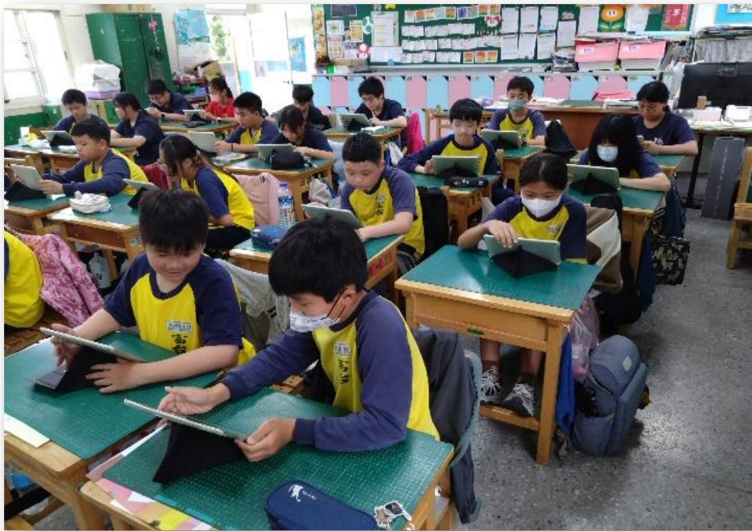
線上文本閱讀與認證