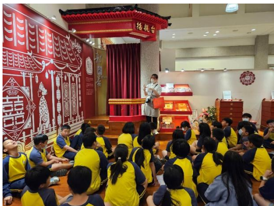
說明：郭元益糕餅博物館—傳統禮俗介紹