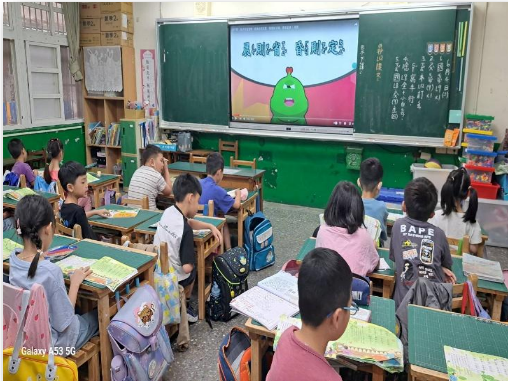
運用多媒體教唱弟子規學習更有勁