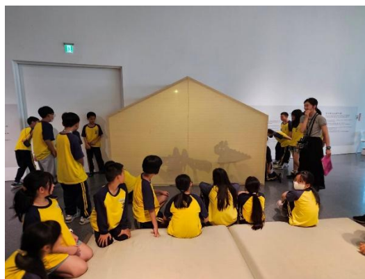
說明：兒童美術館—劇場情境體驗