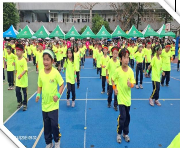
60週年校慶校慶表演—扭扭體操表演活潑有勁