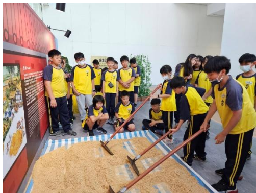
說明：兒童美術館—農事體驗活動