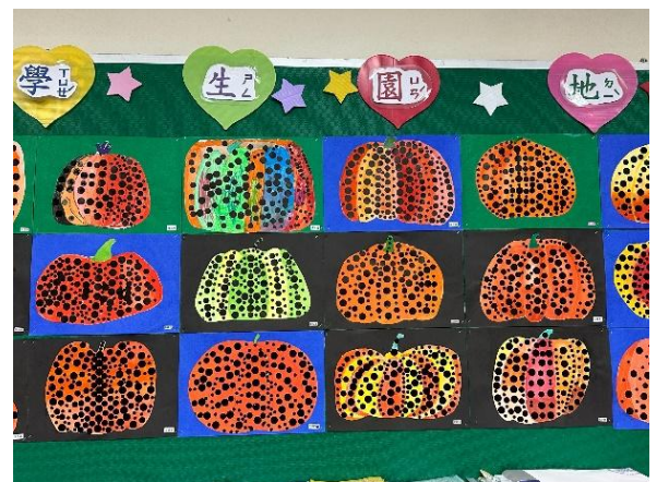
說明：創意南瓜藝廊—作品展示