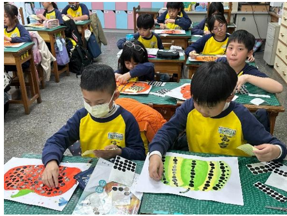
說明：繪製我的創意南瓜