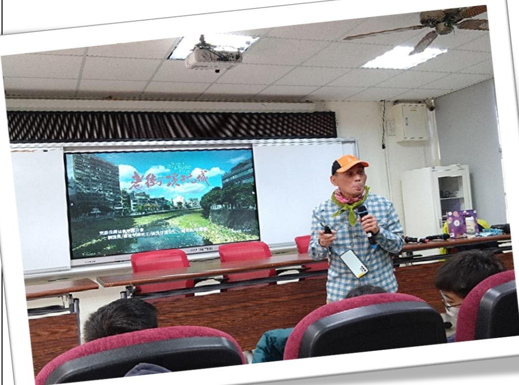
人文講座 邀請荒野協會講 師分享台灣溪流