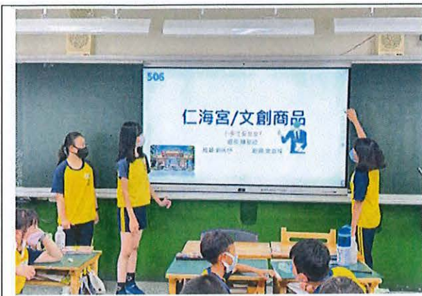
說明：五年級設計仁海宮文創商品