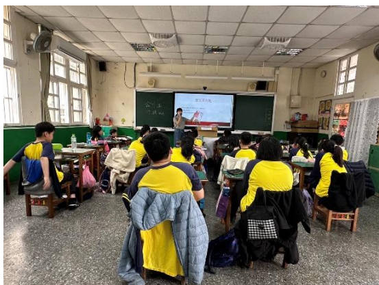
說明：介紹早期的童玩