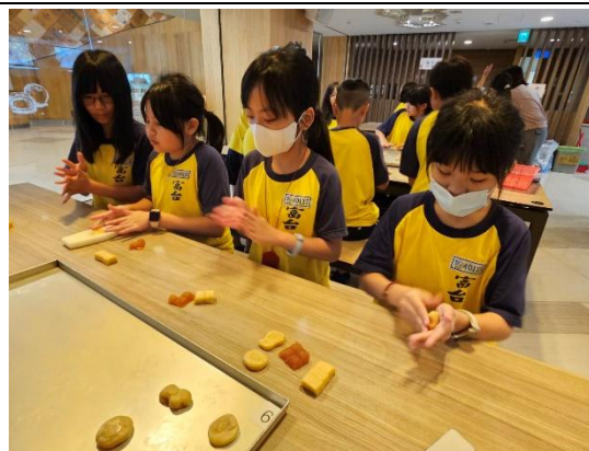
說明：郭元益糕餅博物館—糕餅DIY