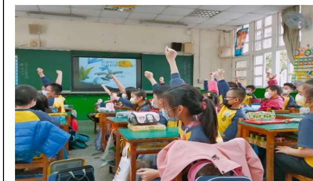
學生表現積極正向的潛在學習結果 (評鑑細項 21.2)