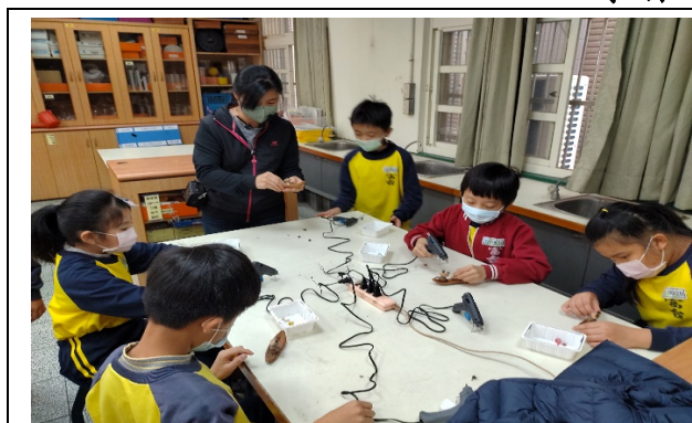
課程設計提供學生實作練習 (評鑑細項 9.2)