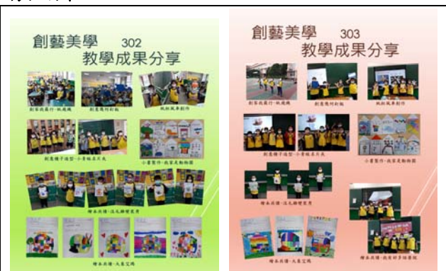
教學單元符合順序、繼續和統整性 (評鑑細項 10.3)