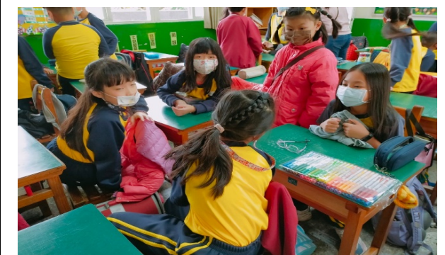
採用相應合適之多元教學策略 (評鑑細項 17.2)