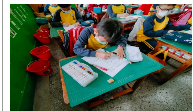
實施多元評量檢測學習成效 (評鑑細項 16)