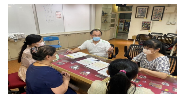
積極參與備、觀、議課 (評鑑細項 13.3)