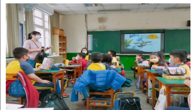
學生學習表現具有持續進展的現象 (評鑑細項 22.1)