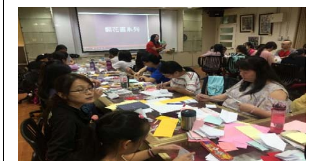
課程實施辦理新課程專業研習 (評鑑細項 13.2)